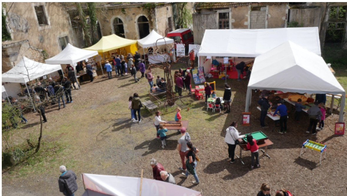
Les Jemas aux Usines Nouvelles, Ligugé

Cette nouvelle structure coopérative d'ambition nationale est portée par la conviction suivante, inscrite en préambule de nos nouveaux statuts : « La résilience d'une organisation, comme celle d'un individu, ne peut advenir qu'en renforçant, par le collectif, la solidarité et l'intérêt général. Dans nos territoires, nous aurons plus que jamais besoin de créer des écosystèmes solidaires, dans lesquels s'inventeront de nouveaux rapports au vivant, aux autres et à soi. Nous aurons besoin de circuits courts alimentaires et énergétiques, mais aussi d'organisations agiles capables d'accompagner les mutations de l'emploi, de structurer le travail autonome, la multi-activité, et de construire de nouveaux droits.